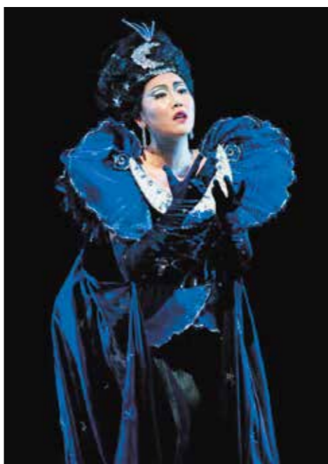
シアトル・オペラ「魔笛」夜の女王役

マーラー交響曲第4番の第4楽章では、ソプラノ独唱には透明感のある歌唱が求められます。天国の喜びを歌う詩を軽やかなオーケストラの伴奏に支えられながら、無垢で詩的な美しさを描き出します。独唱には天使のような純粋な音色が求められ、マーラー特有の精神的な深みと天上的な美しさが凝縮されています。歌詞はドイツの民謡詩集『少年の魔法の角笛』から取られており、天国の純粋な喜びや平和、そして地上の苦勞から解放された魂の幸福を表現しています。演奏者の力量が問われる作品であると感じております。