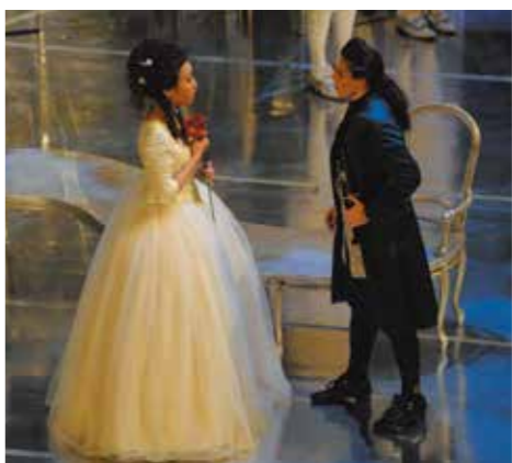
リンツ州立劇場「ばらの騎士」ゾフィー役

主に発声をはじめ、発語、オペラ、歌曲、宗教曲のレパートリーに加え、セルフマネジメントやキャリアを築く上で必要なスキル全般を学びました。