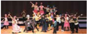
ミュージカル「マ★テ★キ」(2023年より)

サスペンスフルなドラマを谷川賢作 のジャズタッチな音楽が彩ります。 歌うことの楽しさ、仲間の大切さ、前 へ進む勇氣・・・